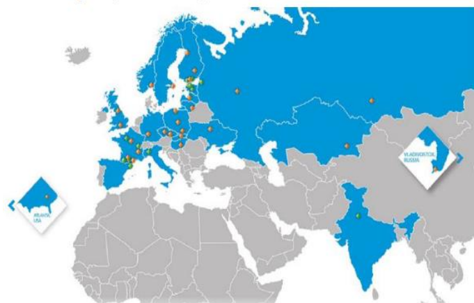
Oddziały Ensto na świecie

Ponadto system pomaga w weryfikacji dostępności auta, hotelu, czy lotu, a także w przygotowaniu zaliczki do wypłaty. Co ważne, wydatki są kontrolowane jeszcze przed wyjazdem, a ostateczne koszty także są księgowane w systemie IFS. System Plus Workflow dba także o to, aby podróż służbowa została poprawnie rozliczona. Pracownik ma do dyspozycji dedykowany moduł, w którym wprowadza dane dotyczące podróży. Dalej system już sam oblicza diety, ryczałty, sumuje koszty – wszystko zgodnie z wymaganiami polskiego prawa.