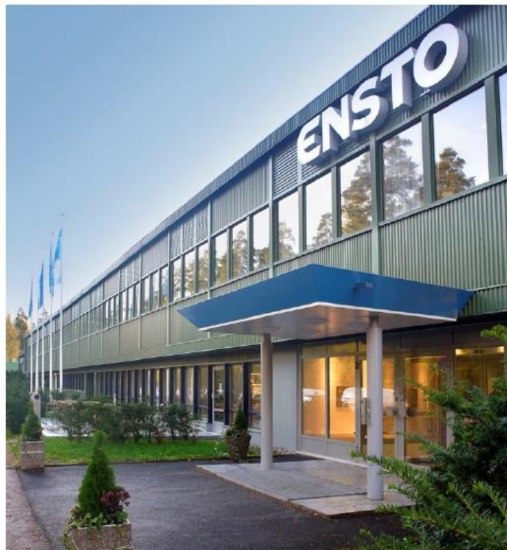
Centrala Ensto w Porvoo

Kolejnym ważnym elementem wdrożenia była implementacja rozwiązania do dystrybucji faktur sprzedaży. W tej części wdrożenia specjaliści Suncode wprowadzili moduł, który odpowiada za automatyczne przesyłanie wystawianych w systemie IFS faktur sprzedaży do klientów spółki. Dzięki temu rozwiązaniu pracownicy Ensto Pol mogą z łatwością kontrolować m.in. kiedy dokument trafił do odbiorcy i czy odbiorca potwierdził fakt jego otrzymania. Tym samym Ensto Pol stale monitoruje status wysłanych faktur i szybko weryfikuje ewentualne błędy w wystawionych fakturach. Wszystkie wystawiane w systemie IFS faktury sprzedaży są rejestrowane i archiwizowane w elektronicznym repozytorium systemu Plus Workflow.